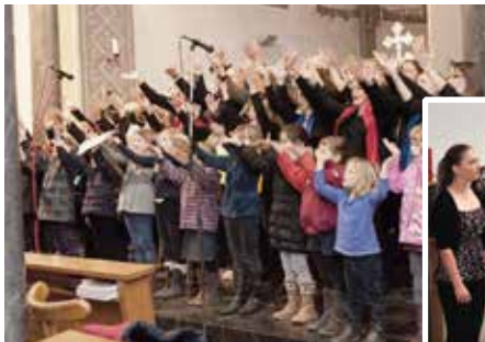
2012 Der Kinderchor und der Gospelchor gemeinsam im Konzert

Das Jubiläumskonzert findet am Sonntag, den 5.7.2026 um 17 Uhr in der Ev. Kirche Lintorf statt! Es gibt ein tolles, erinnerungsreiches Konzertprogramm. Alle Gäste sind bei freiem Eintritt herzlich willkommen.