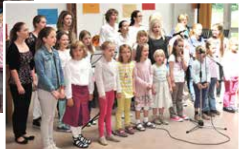
2015 Der Familienchor mit dem Kinderchor und dem Jugendensemble

2026 We proudly present: Familienchor Lintorf-Angermund Herzlichen Glückwunsch zum 15. Geburtstag!